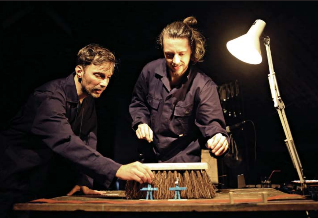
PNTheater speelt 'Werktuig' (pag. 15)